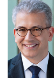
Tarek Al-Wazir Hessischer Minister für Wirtschaft, Energie, Verkehr und Landesentwicklung

„Mit einer dualen Berufsausbildung lassen sich mehrere Ziele gleichzeitig erreichen: Man erhält einen anerkannten Berufsabschluss mit besten Zukunftsaussichten, erwirbt außerdem einen höheren Schulabschluss und verdient auch noch Geld. Die duale Berufsausbildung ist daher eine interessante Alternative. Alle Prognosen sagen hervorragende Aussichten für Arbeitskräfte mit beruflicher Bildung voraus.“